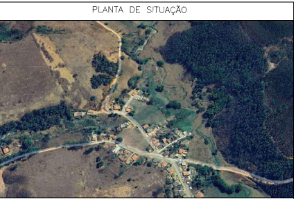
PLANTA DE SITUAÇÃO