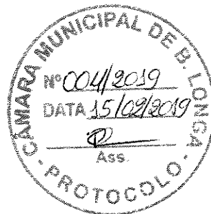
Elísio Pereira Barreto Prefeito Municipal